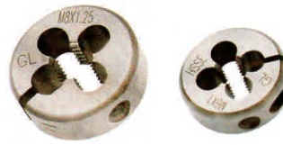
AR-D可调式圆板牙 AR-D Adjustable Circular Die